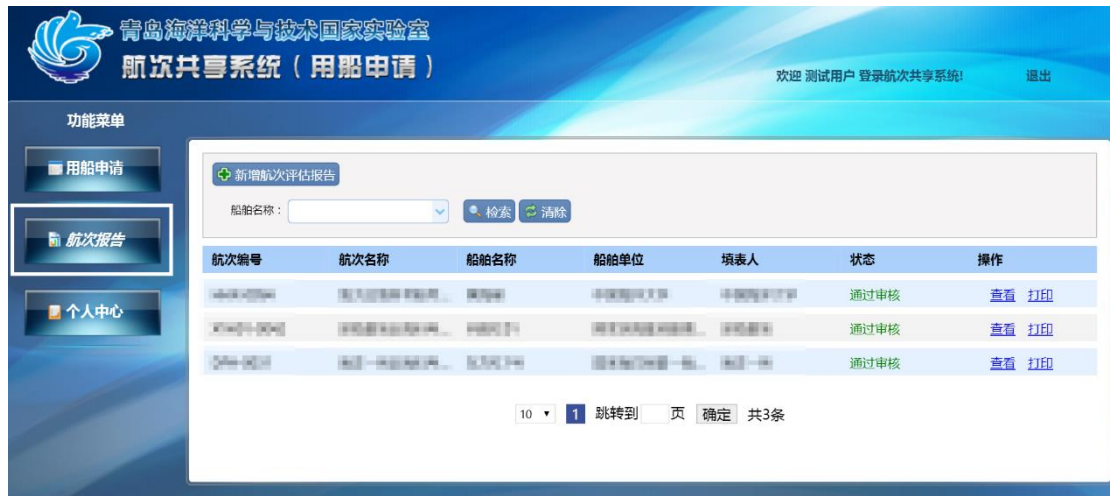
图 1-12 航次报告