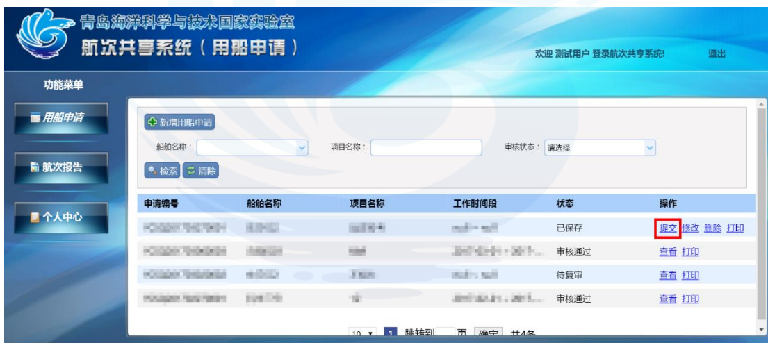
图 1-9 提交用船申请

点击【提交】，将此条信息提交管理方审核，提交前状态显示为已保存，提交后状态显示为待初审，如图 1-9 所示：