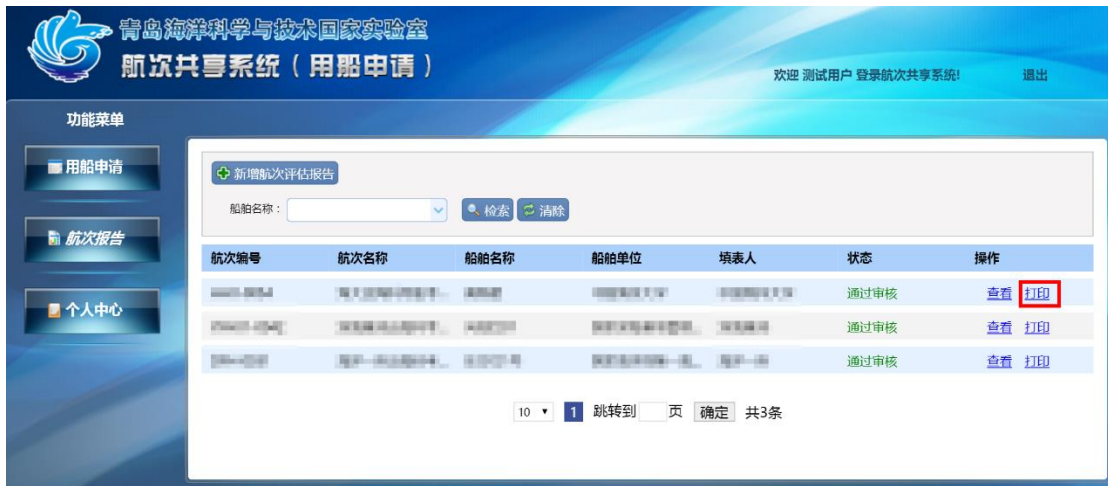
图 1-16 打印航次评估报告