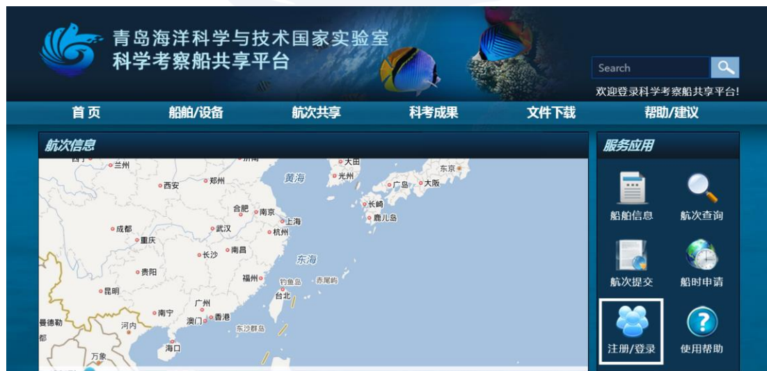
图 1-1 注册登录