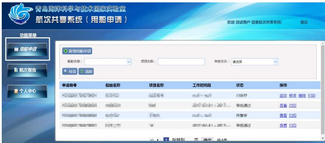
图 1-6 用船申请