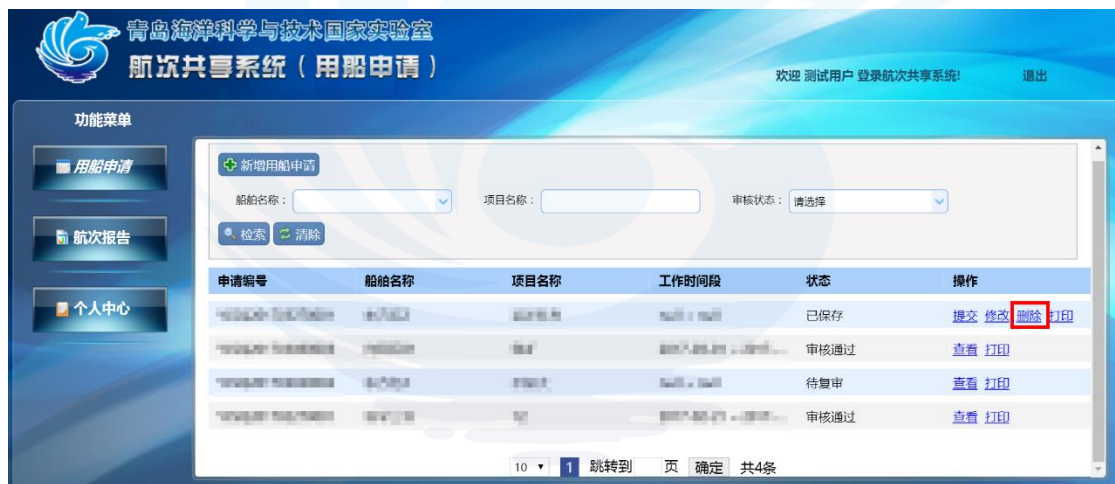
图 1-11 删除用船申请

未提交的信息，点击【删除】，即可删除信息，已提交的信息不允许进行删除，如图 1-11 所示：