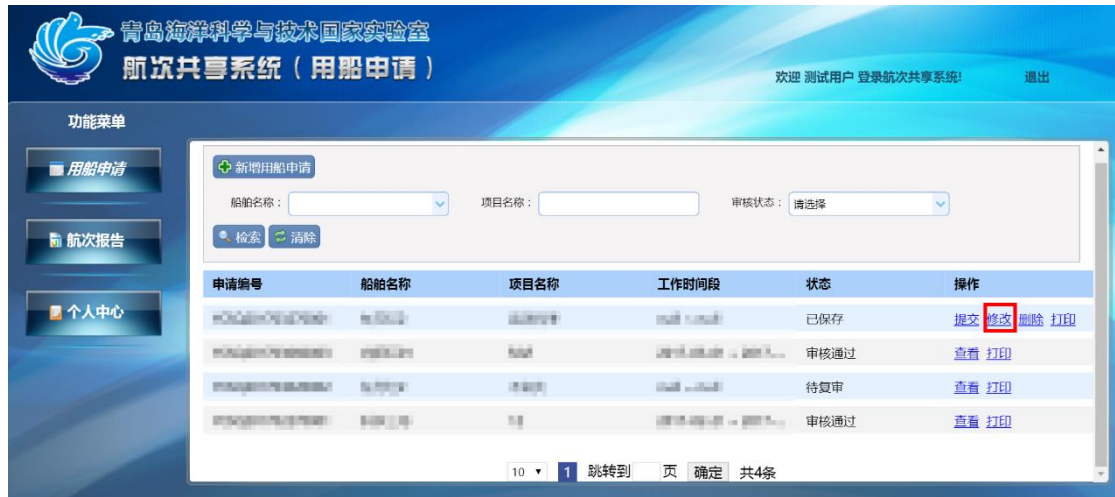
图 1-10 修改用船申请