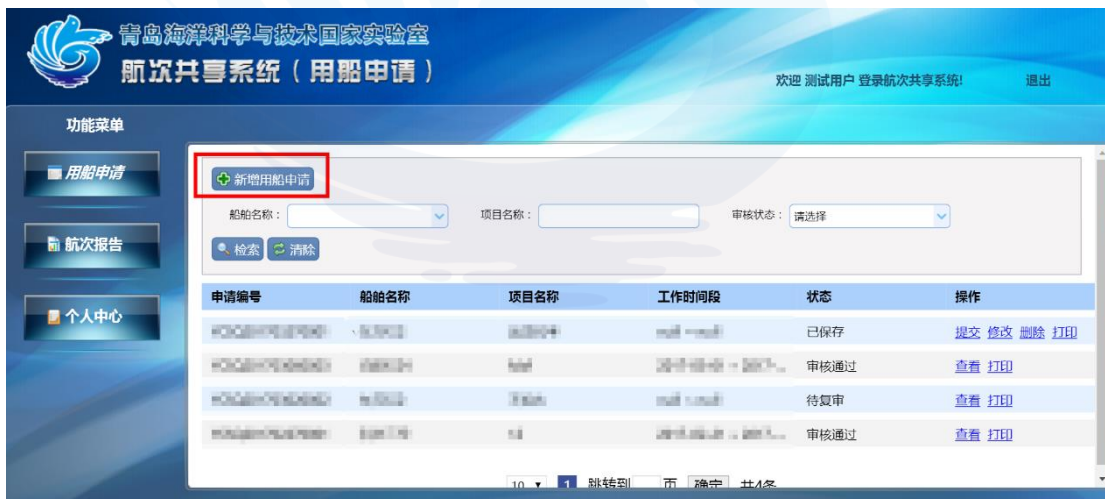
图 1-7 新增用船申请

点击【新增用船申请】进入添加用船申请的页面，按照提示框填写相关信息，点击【提交】按钮可将填好的数据提交存储，红色星号为必填项，如图 1-7、图 1-8 所示：