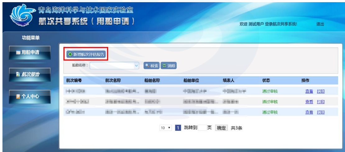
图 1-13 新增航次评估报告

点击【新增航次评估报告】，按照提示框填写相关信息，点击【保存】按钮可将填好的数据提交存储,如图 1-13、图 1-14 所示: