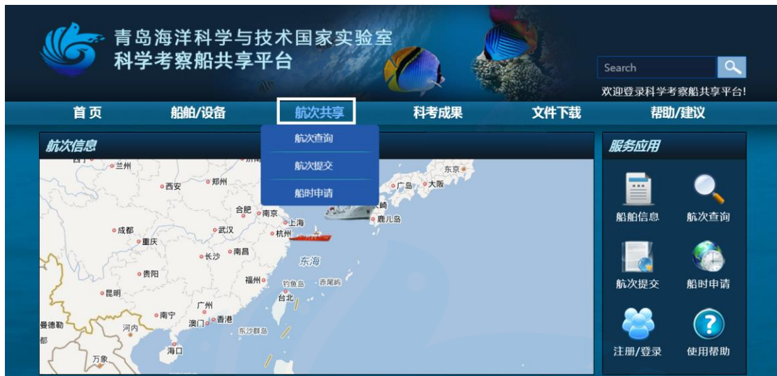
图 1-4 航次共享

所有的航次用户登录后可在网站首页点击【航次共享】查看航次信息，如图 1-4 所示：