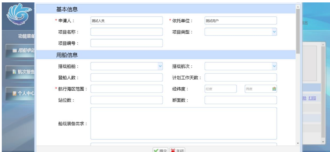
图 1-8 用船申请信息