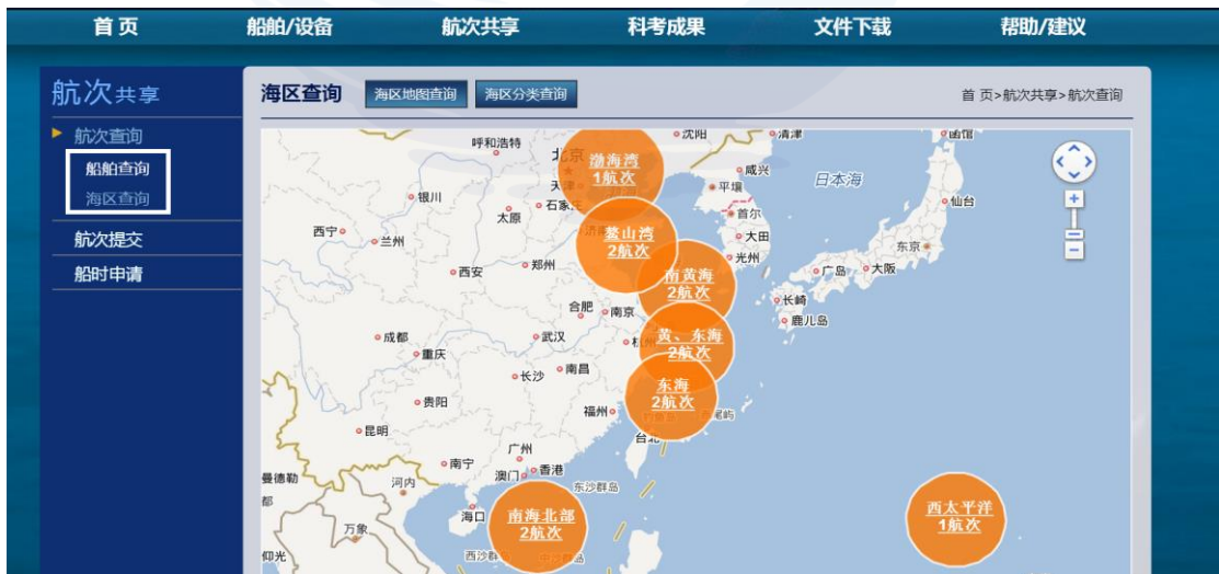
图 1-5 海区查询

航次用户可通过点击【航次查询】中的【船舶查询】和【海区查询】选择查看船舶航次计划和航行海区，如图 1-5 所示：