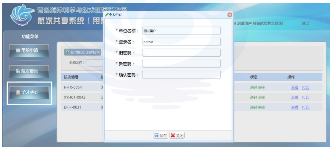
图 1-17 个人中心

点击【个人中心】进入密码修改子界面，输入新密码以及确认密码保存后，修改密码成功，如图 1-17 所示：